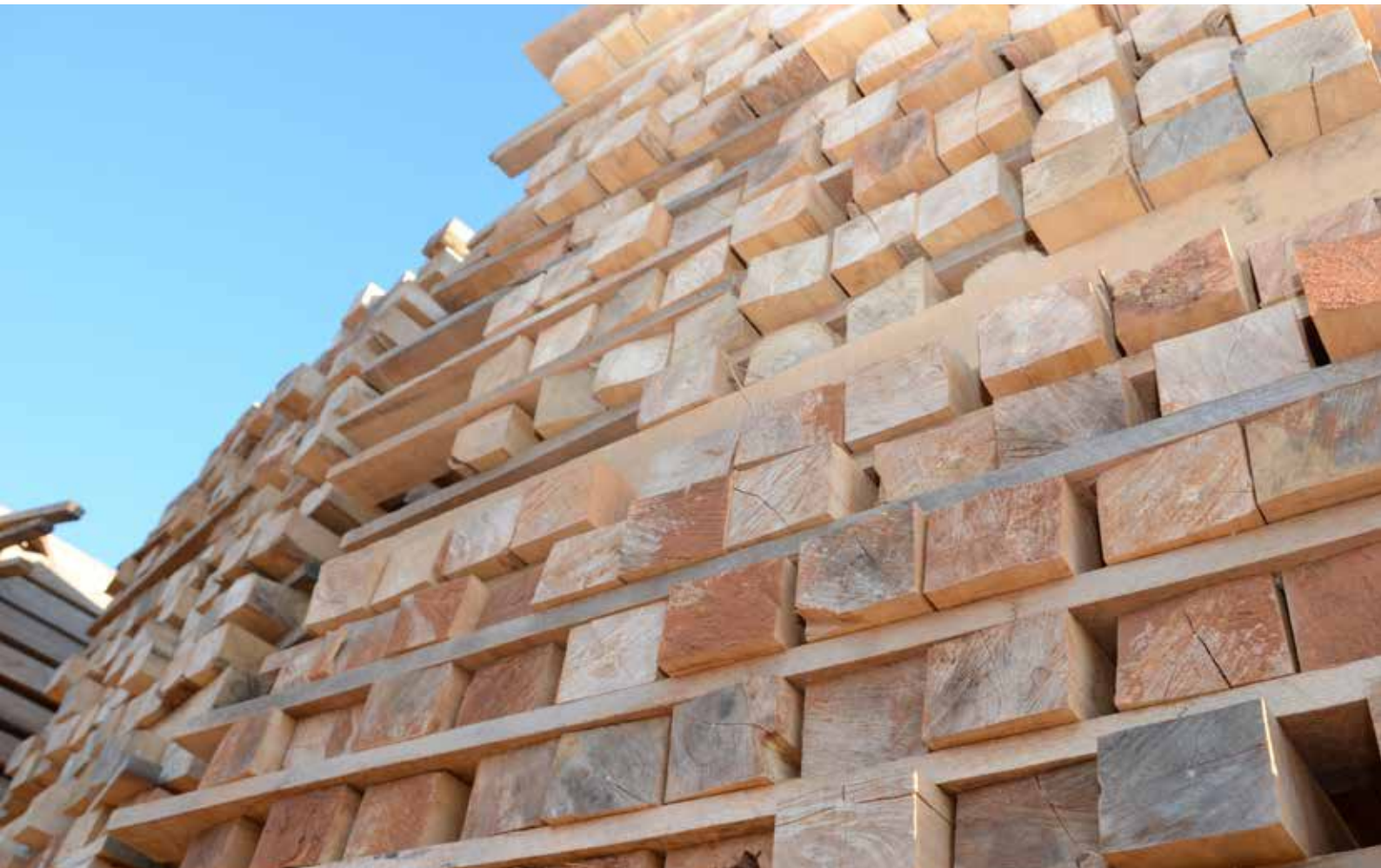
Le chiffre d'affaires réalisé par la vente du teck équarri de ShareWood augmente grâce à la grande demande de l'Inde.