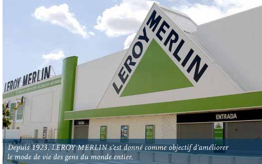
Depuis 1923, LEROY MERLIN s'est donné comme objectif d'améliorer le mode de vie des gens du monde entier.