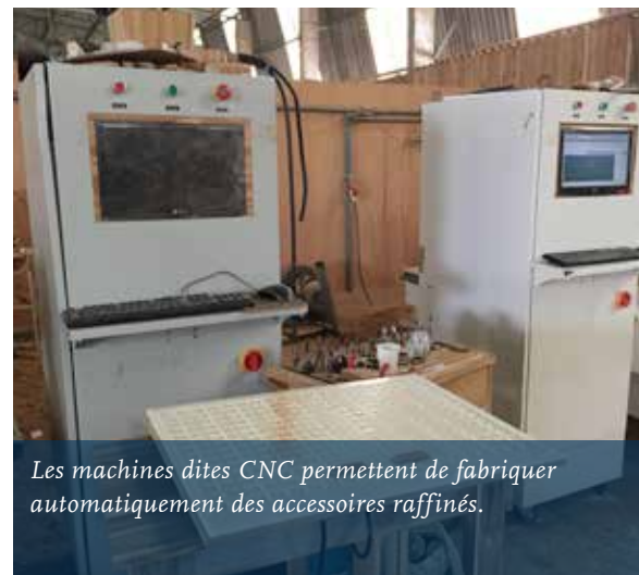
Les machines dites CNC permettent de fabriquer automatiquement des accessoires raffinés.