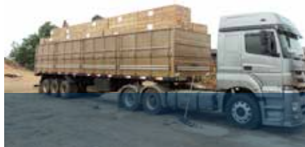
Augmentation du CA vente de bois: p. 6