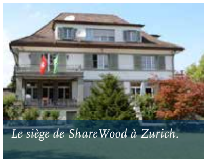
Le siège de ShareWood à Zurich.