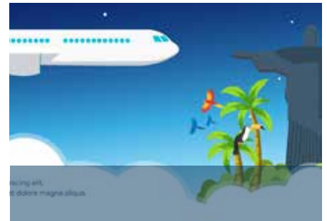
Grand concours: p 8