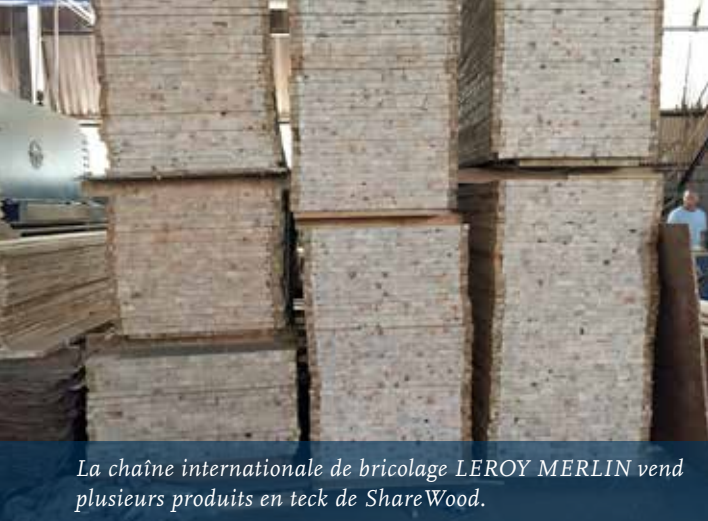
La chaîne internationale de bricolage LEROY MERLIN vend plusieurs produits en teck de ShareWood.