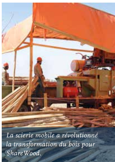
La scierie mobile a révolutionné la transformation du bois pour ShareWood.