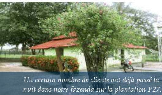
Un certain nombre de clients ont déjà passé la nuit dans notre fazenda sur la plantation F27.

Des nombreux rapports positifs que nos clients ramènent de leur voyage après avoir rendu visite à nos opérations au Brésil. Cela nous motive à travailler à notre projet avec encore plus d'enthousiasme.